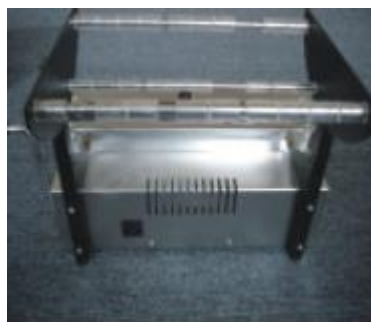
Рис. 2-2 Установка опоры для рулонов